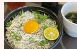
ふんわり食感と自然な甘みが魅力の釜揚げしらす丼。お味噌汁とドリンクも嬉しい!