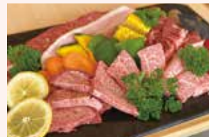
GANGセット。お肉が分厚く食べ応え抜群!