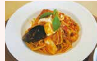
ペスカトーラなど洋食メニューが豊富