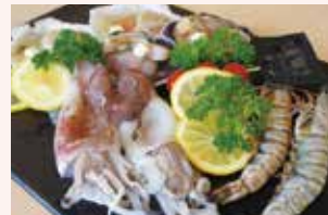
新鮮な海鮮も豊富!お酒が進みそう。