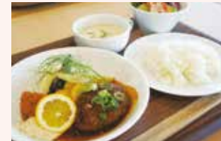
この日のランチは「サーモンフライとハンバーグ」