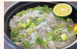
新鮮な証、ここでは食べられない生しらす丼。

11:00-14:00 17:00-20:30 L.O. マルシェ開催時 10:00~売切れ次第終了 (7月~9月 8:00~) 天候不良時お休み